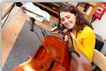
Abbildung 1: Was könnte dein Traumberuf sein?

Im Rückblick auf den Song „Junge“ von „Die Ärzte“ und das Gedicht „My own song“ von Ernst Jandl: Wie willst du später sein wie du bist? Stelle dir dazu Folgendes vor: