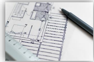
Abbildung 1: Gebäudeplan