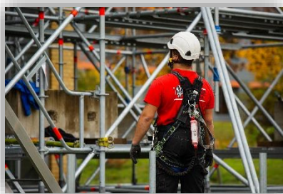
Abbildung 2: Gerüstbauer

Im Rahmen der Berufsorientierung beobachten wir alle (un-)bewusst unsere Umwelt, wir bewerten schulische Lernangebote, recherchieren im Internet, führen Praktika durch und nehmen an Beratungsgesprächen teil. Die gewonnenen Erkenntnisse können zu geschlechterstereotypen Berufsbildern beitragen.