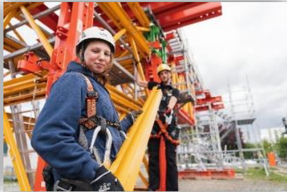
Abbildung 3: Gerüstbauerin

Gerüstbauer/-innen rüsten Fassaden mit Arbeits- und Schutzgerüsten ein. Sie wählen die erforderlichen Gerüstteile aus, verladen diese mithilfe von Hebegevätern, transportieren sie zur Baustelle und montieren sie. Vor dem Aufbau ebnen sie, wenn nötig, den Untergrund ein oder bringen lasttragende Unterlagen an. Sie montieren Systembauteile und verankern das Gerüst am Bauwerk. Im Spezialgerüstbau stellen sie nicht nur die üblichen Gerüste an Häusern auf, sondern errichten auch spezielle Konstruktionen wie Traggerüste als Unterkonstruktion für Betonschalungen, zum Beispiel beim Brückenbau, oder fahrbare Arbeitsbühnen, beispielsweise an Hochhäusern. Wenn die Gerüste nicht mehr benötigt werden, bauen sie diese fachgerecht ab. Sie lagern die Gerüstteile und halten sie instand.