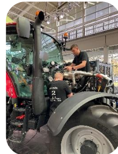
Abbildung 1: Land- und Baumaschinenmechatroniker

Von Fahrzeugbremsen bis Baumaschinen – Hydrauliksysteme haben unseren Alltag revolutioniert. Lass uns gemeinsam schauen, wo überall Hydraulik versteckt ist.