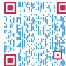
Scanne mich: Webseite der bpb