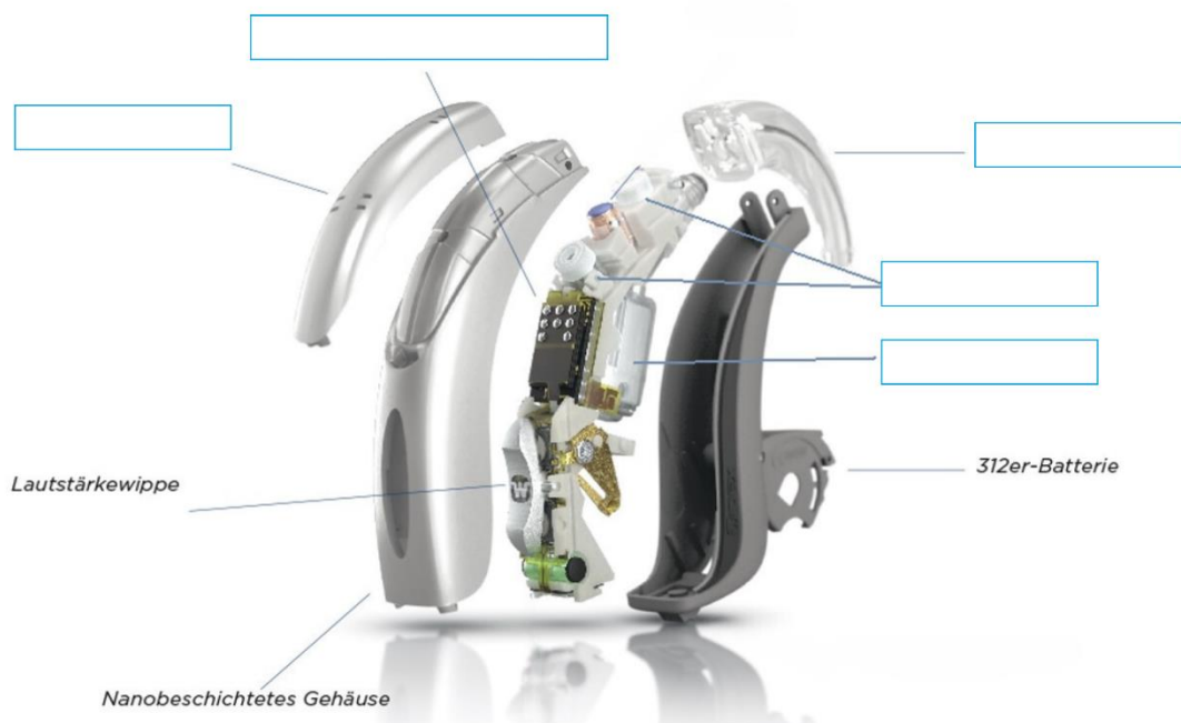
Bestandteile Hörgerät

Digitaler Signalprozessor (DSP), Mikrofonabdeckung, Mikrofone, Hörer, Hörwinkel