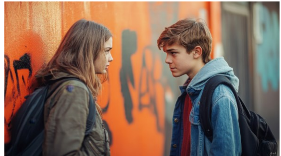
Konflikt zwischen Peers

Milan: „Schon. Aber in letzter Zeit kommt’s öfter so rüber, als wärst du einfach nur genervt von mir.“