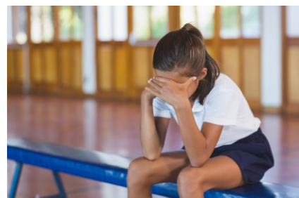
Diskussionen nach dem Sportunterricht

Lena: Was ist los? War doch nur ein Spaß.