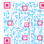
Scann mich: EWKFondsG