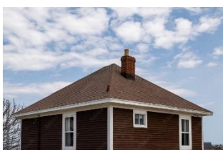
Zelt Dach

Bei einem Haus mit Satteldach sollen beide Giebfelder gestrichen werden. Die Breite und Länge der Dachkante betragen jeweils 6 m und das Dach hat einen Neigungswinkel von 60°. Berechne den gesamten Flächeninhalt und die Materialkosten, wenn mit 48 Euro/m 2 zu rechnen ist.