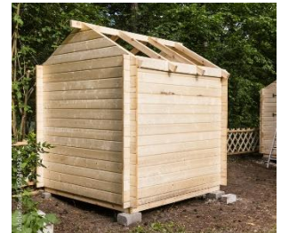
Bau eines Gartenschuppens

Woher weißt du, wie viel Material du brauchst, wenn du beispielsweise ein Sonnensegel aufspannen willst oder ein neues Dach für deinen Gartenschuppen planst? In beiden Fällen musst du wissen, wie groß die Fläche ist – denn viele solcher Flächen sind dreieckig. Dachdeckerinnen und Dachdecker berechnen zum Beispiel täglich solche Formen, um Material zu planen und Verschnitt und somit auch Kosten zu vermeiden. Und auch im Alltag hilft die Flächenberechnung weiter. Hier findest du heraus: Wie berechnet man die Fläche eines Dreiecks – und wofür brauchst du das selbst in deinem Alltag?