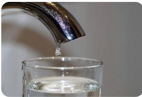
Abbildung 1: Wasserhahn

Wie kann man Wasser zuhause sparen? Fülle den Lückentext mit den unten aufgeführten Begriffen aus!